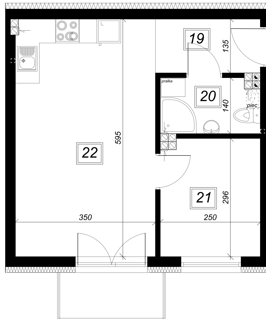
PIĘTRO I: Zestawienie powierzchni