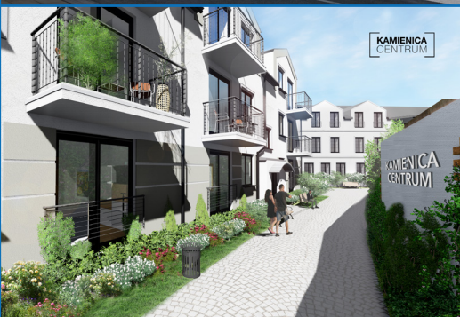
PIĘTRO I: Zestawienie powierzchni