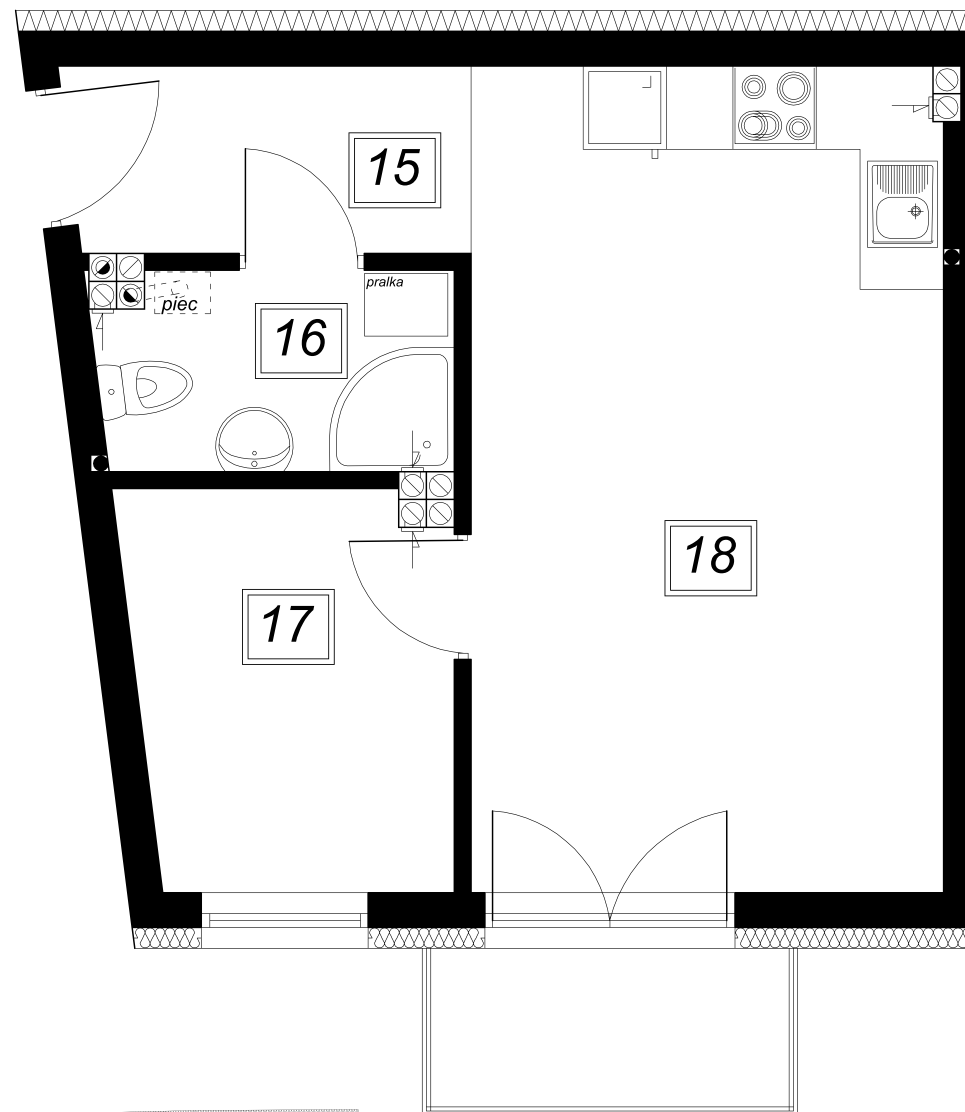
PIĘTRO I: Zestawienie powierzchni